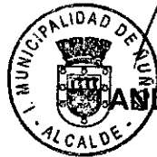
ANDRÉS ZARHY TROY ALCALDE

Anótese, comuníquese y transcribese a todas Direcciones Municipales. Cúmplase y hecho archívese en el Repositorio Digital y publíquese en la página Web Municipal y en Banner de Transparencia Municipal.